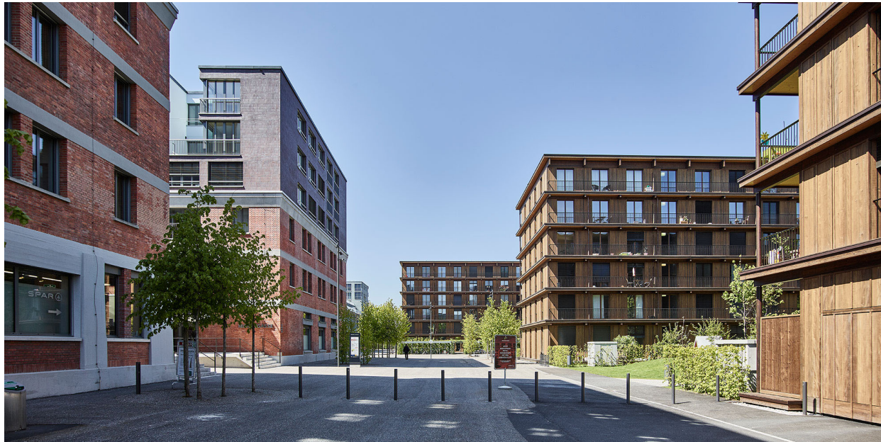
Platzgestaltung Zollfreilager Zürich