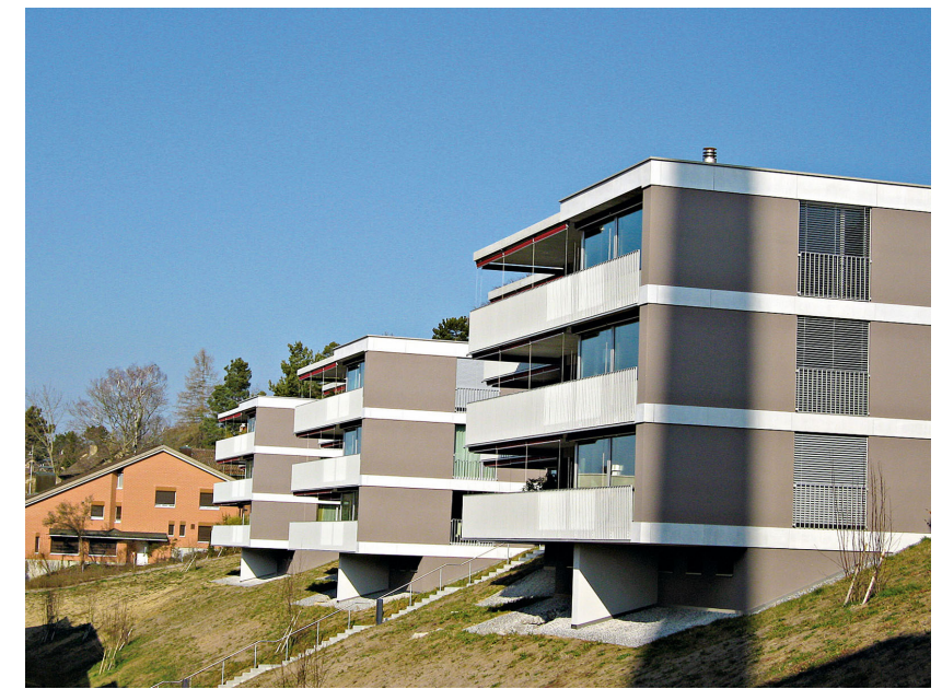
Siedlung Haldengut Areal Winterthur Marcel Ferrier Architekten