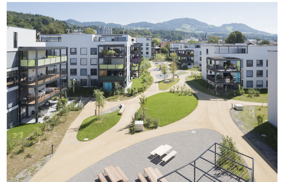
Quartierwege, Überbauung "Mosaik" Hinwil Planung TUR Landschaftsarchitekten, Realisierung Halter AG