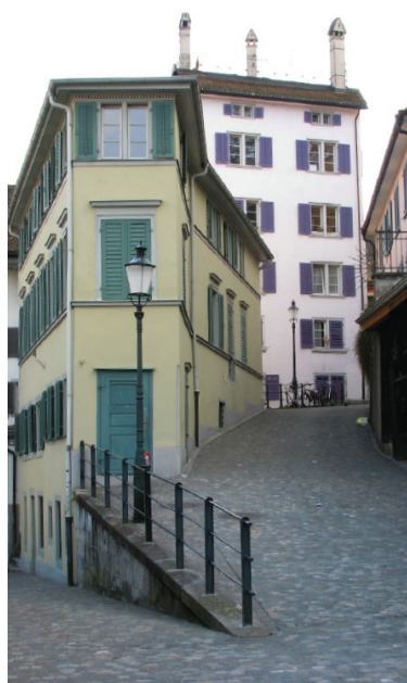
Innenstadt Zürich, Schweiz