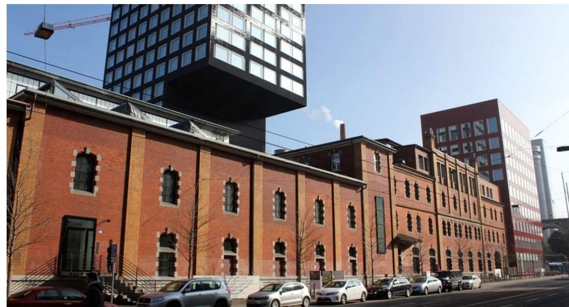
Löwenbräu Areal, Zürich ARGE Gigon Guyer und Atelier WW, Zürich