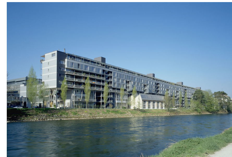
Limmatwest Zürich Kuhn Fischer Architekten Entwicklung und Realisierung Halter AG (Fertiggestellt)