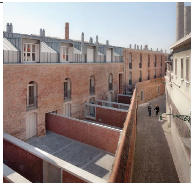
Studio Macola, Murano, Italien