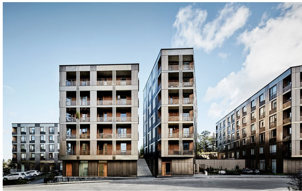
"The Bronze", Stockholm, Schweden