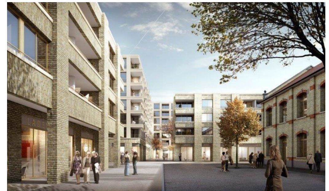
Zwicky Zentrum, Wallisellen Giuliani Hönger Architekten, Zanoni Architekten, Zürich Entwicklung/Realisierung Halter AG (Bezug 2019)