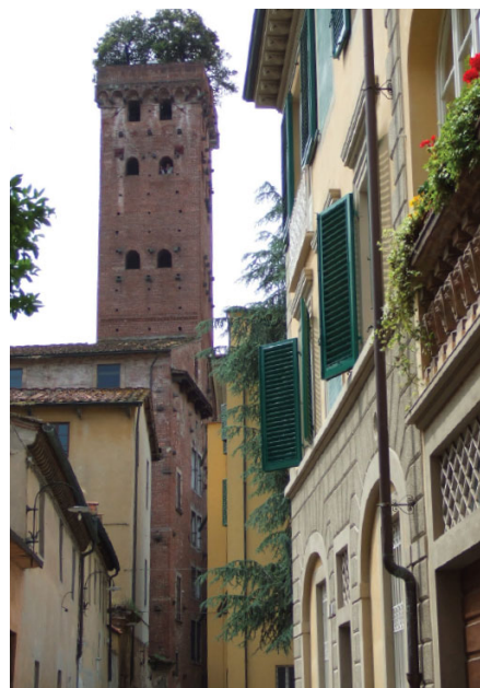
Innenstadt Lucca, Italien