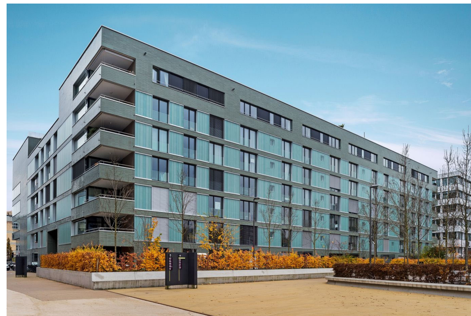
Hard Turm Park, Zürich Theo Hotz Architekten AG; Entwicklung/Realisierung Halter AG