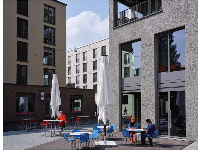
Platzgestaltung Aeschbachquartier Aarau