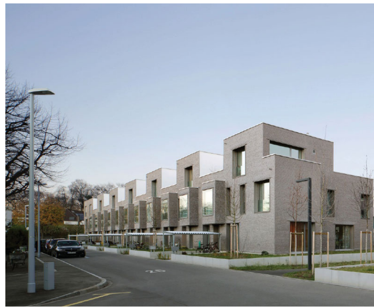
"Schorenstadt", Basel Burckhardt Partner Architekten