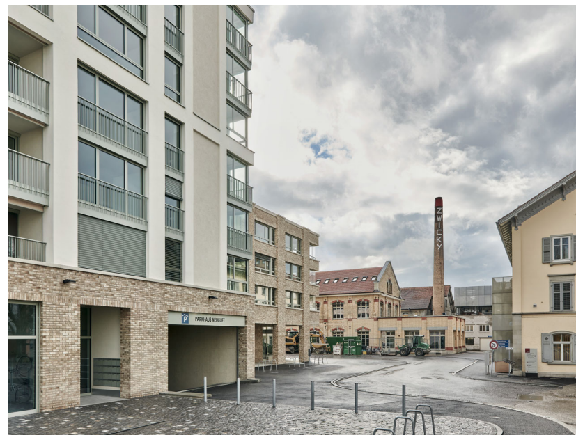
Gasse Zwicky Zentrum, Wallisellen Planung Appert&Zwahlen, Realisierung Halter AG