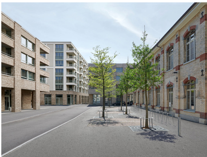
Zwicky-Zentrum, Wallisellen Giuliani Hönger Architekten, Zanoni Architekten Entwicklung und Realisierung Halter AG (Fertiggestellt)