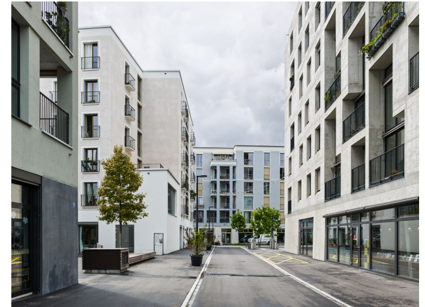
Gasse Hunziker Areal Zürich