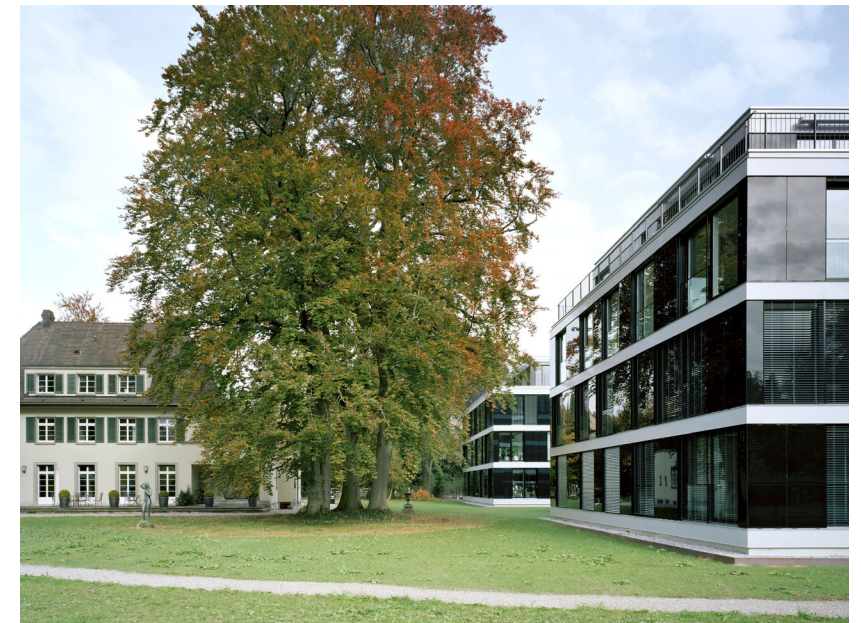
Fehlmann Areal Winterthur Bob Gysin & Partner, Zürich