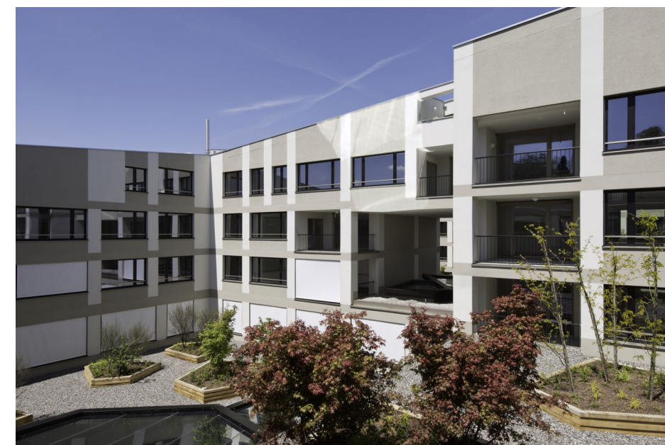
Archhöfe, Winterthur ZH BDE Architekten, Winterthur Entwicklung/Realisierung Halter AG