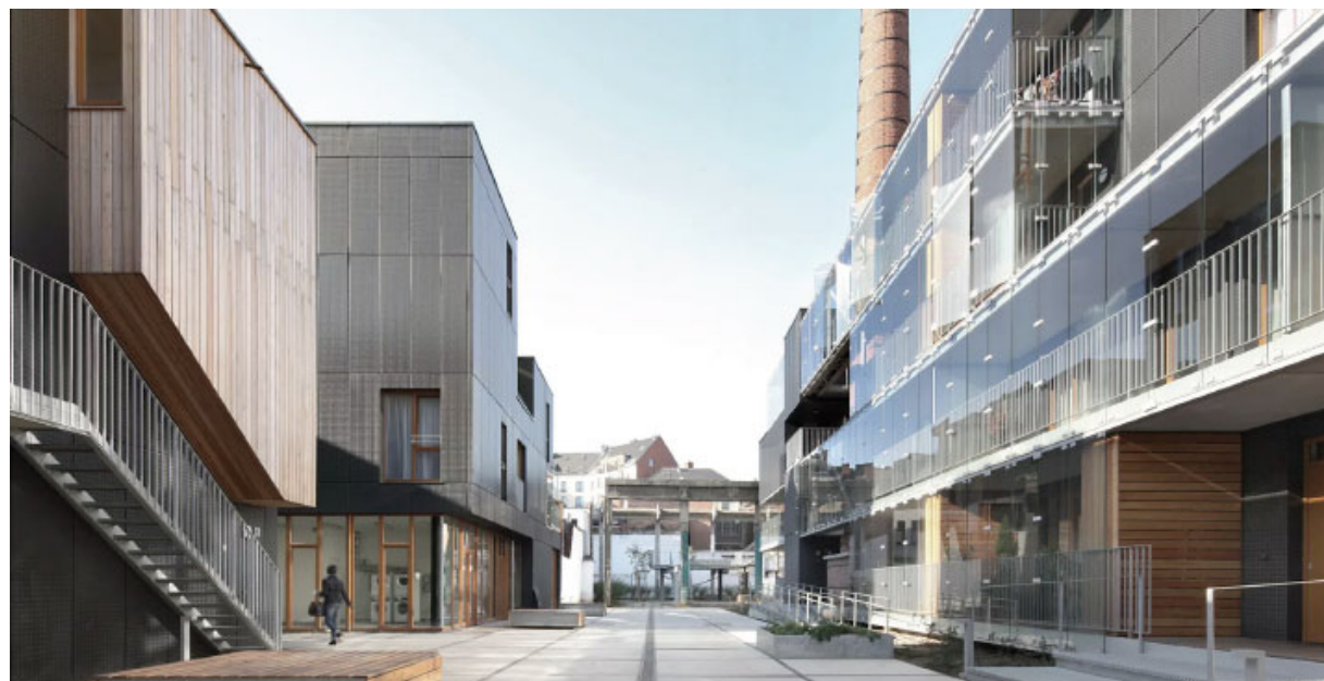
Savonnerie Heymans, Brüssel, Belgien