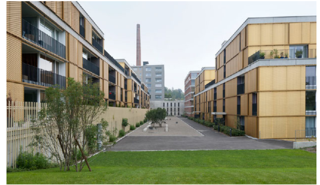
Haldengut Areal Winterthur Marcel Ferrier Architekten, St. Gallen