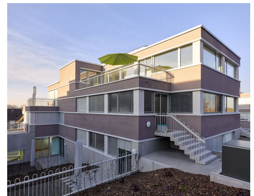
Wohnüberbauung Glaubtenstrasse, Zürich BDE Architekten, Winterthur Entwicklung/Realisierung Halter AG