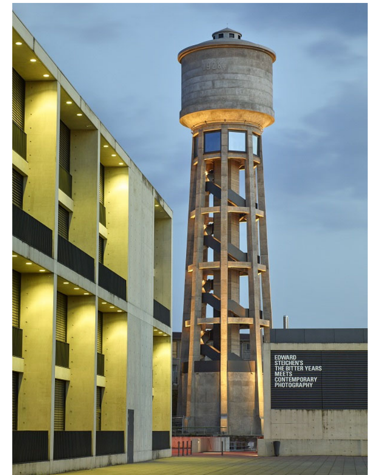
Umnutzung Wasserturm, Dudelange LU kaell architecte | Jim Clemes Atelier d'Architecture et de Design