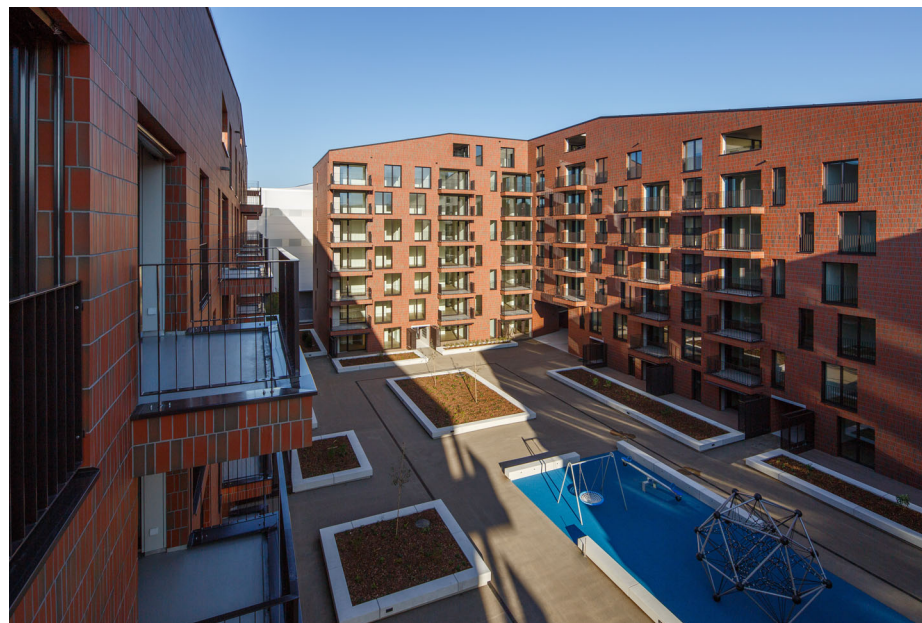
Wohnen am EBISQUARE, Ebikon LU TGS Architekten, Luzern; Entwicklung/Realisierung Halter AG