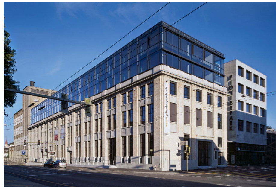
Pionierpark, Winterthur Nil Hürzeler Architekten, Erlenbach