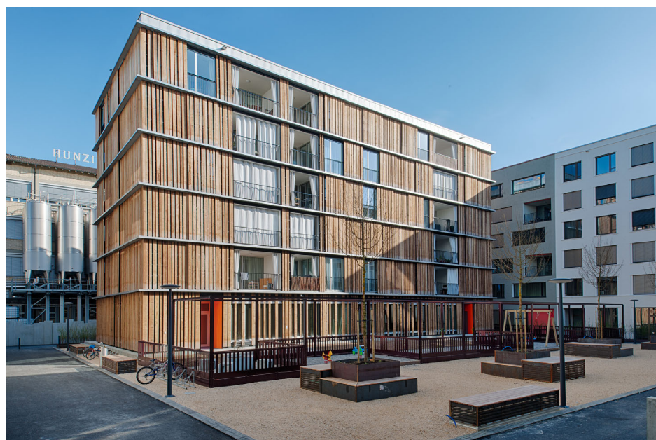
Zypressenhof, Limmatfeld, Dietikon ZH Diverse Architekten Entwicklung/Realisierung Halter AG