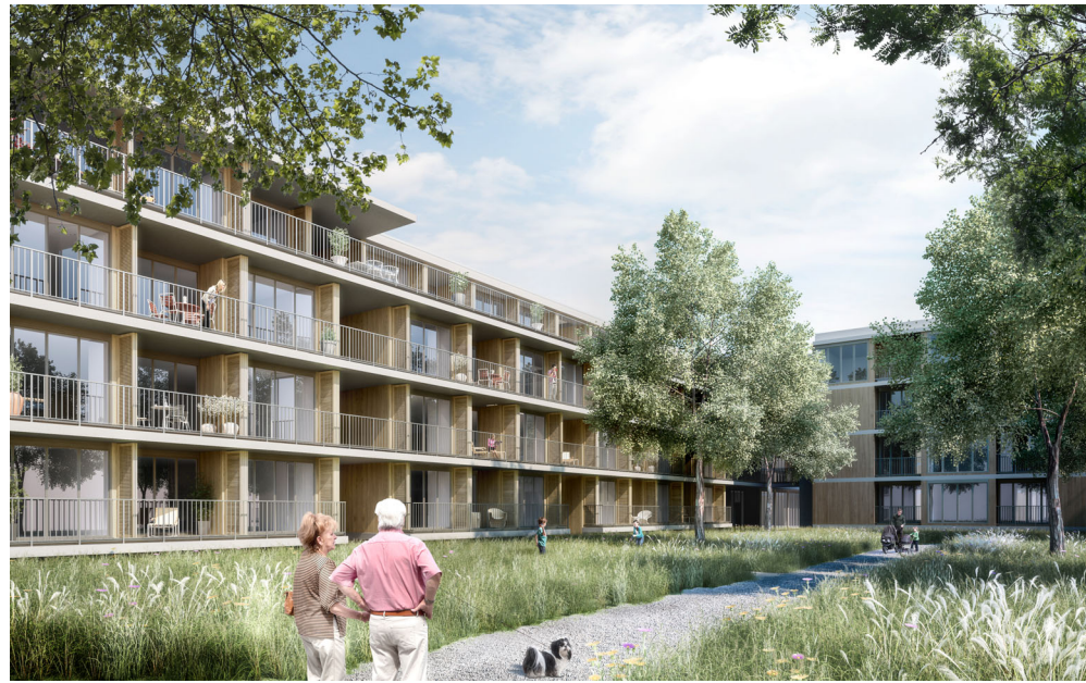
Buchsiguet, Herzogenbuchsee (Bezug 2021) Aebi Vincent Architekten, Bern; Entwicklung Halter AG