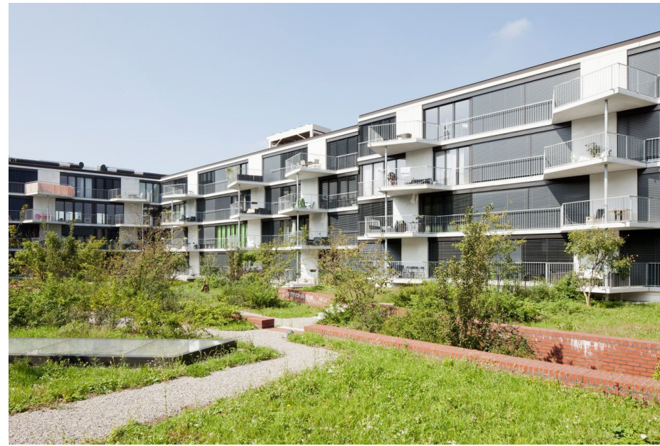
Parkside, Schlieren ZH Weberbrunner Architekten, Entwicklung/Realisierung Halter AG