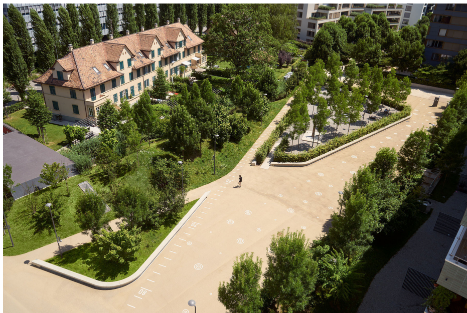
Hard Turm Park Zürich; Begrünung Aussenräume Planung Vetsch Partner, Realisierung Hardturm AG/Halter AG