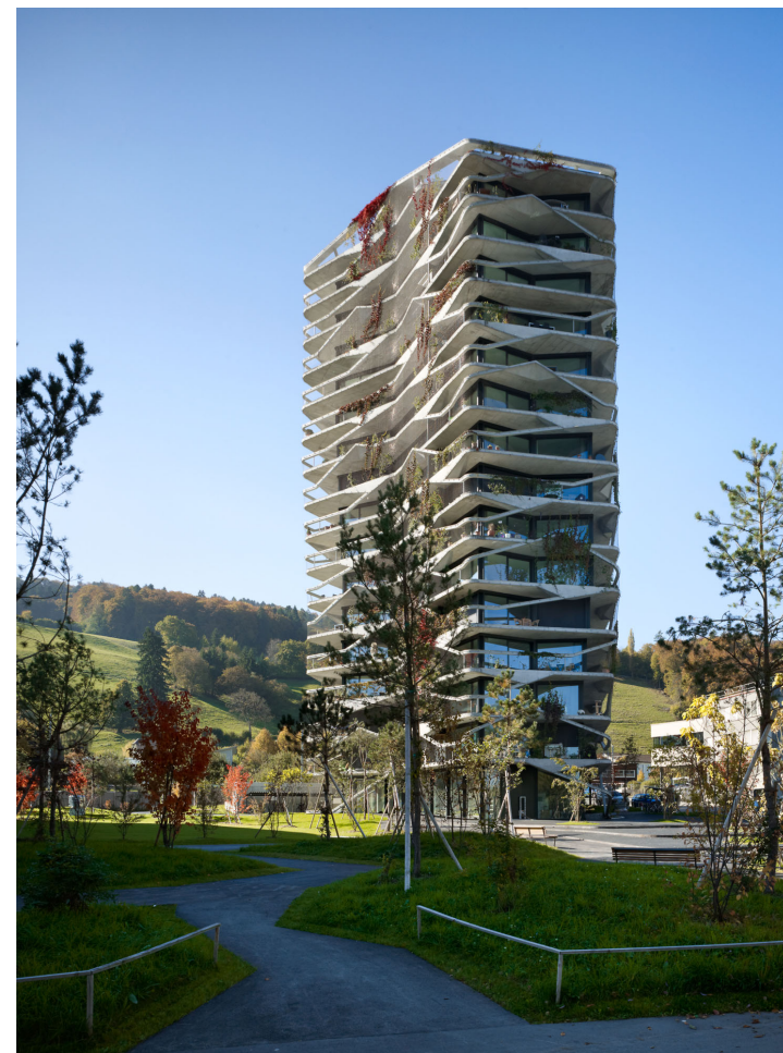
Garden Tower Wabern Buchner Bründler, Basel