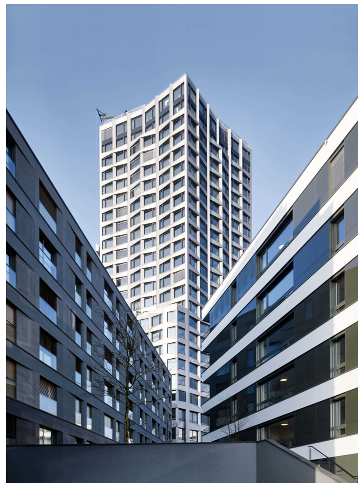
Limmattower, Dietikon huggenbergerfries Architekten AG Entwicklung/Realisierung Halter AG