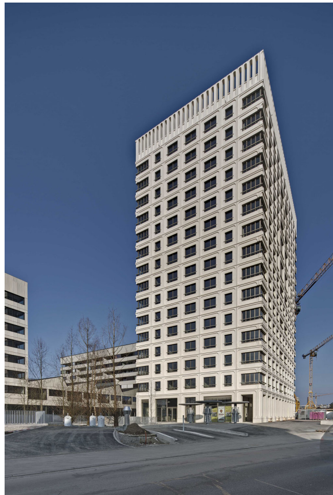
Am Rietpark, Schlieren Dietrich Schwarz Architekten Entwicklung/Realisierung Halter AG