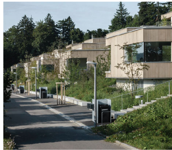
"zum Landenberg", Winterthur