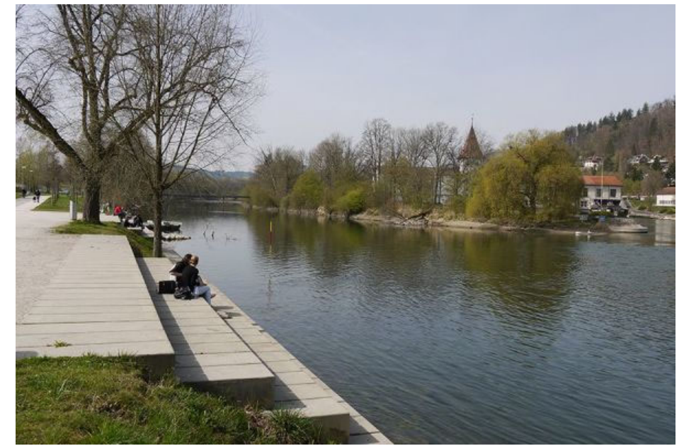
Ufergestaltung Aare Aarau