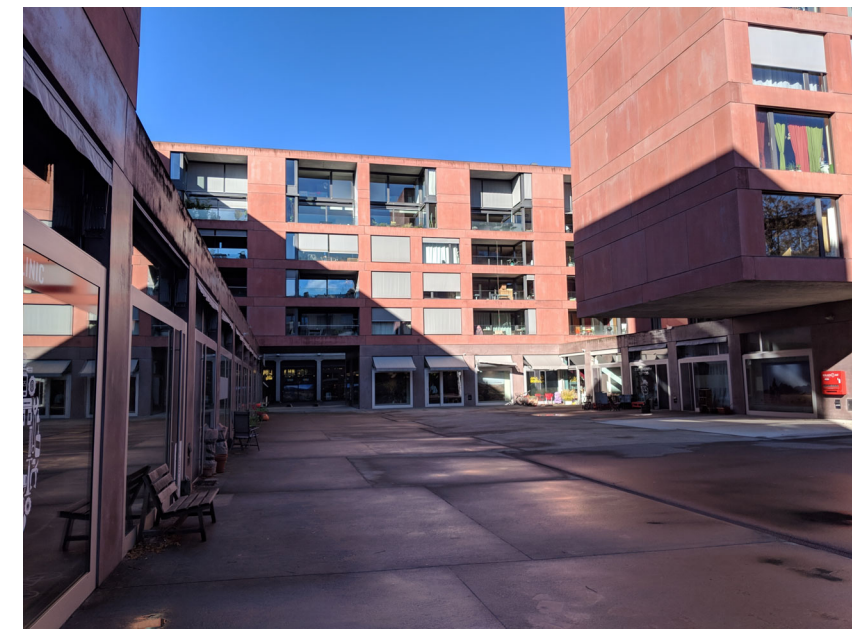
Überbauung Sieb-Zehn, Sulzer Area, Winterthur Kaufmann van der Meer Architekten, Zürich