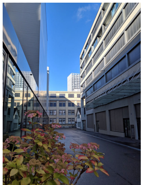
Sulzer - Areal, Winterthur ZH