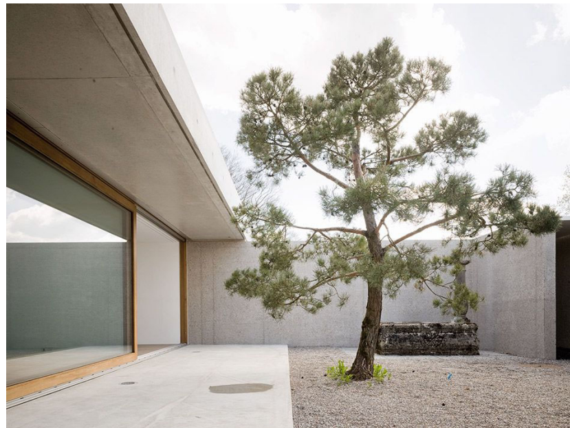
oberes Alpgut, Winterthur Peter Kunz Architekt, Winterthur