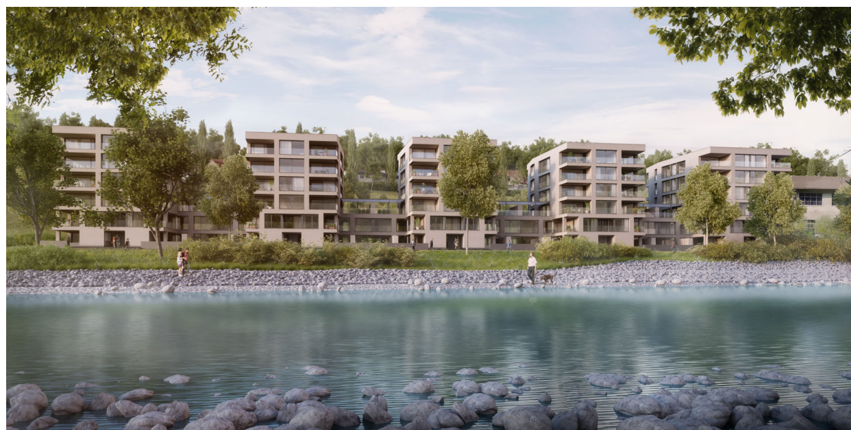
Hammerwerke Worblaufen Büro B, Bern Entwicklung/Realisierung Halter AG