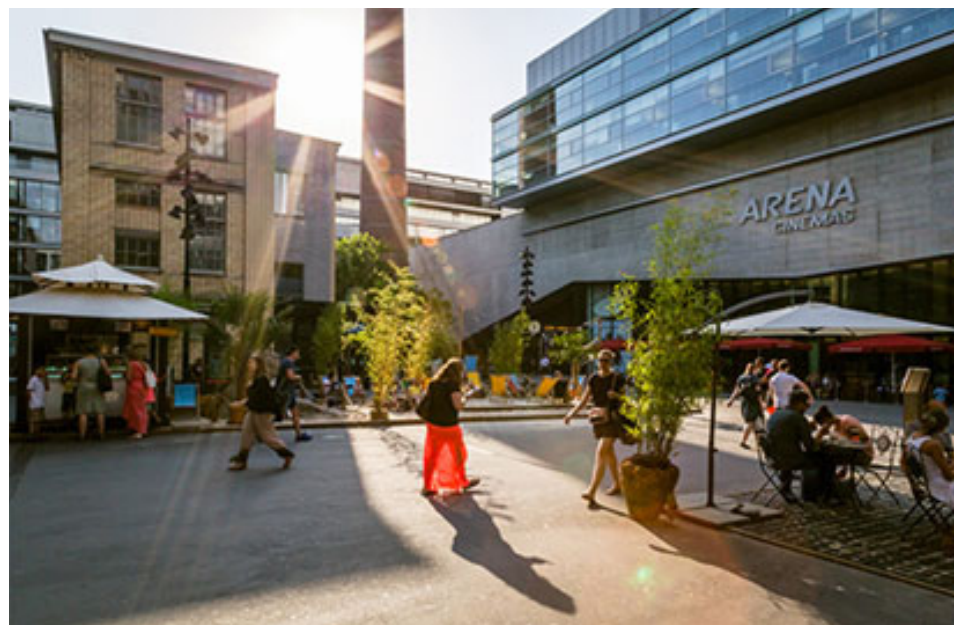
Sihlcity Zürich Theo Hotz Architekten