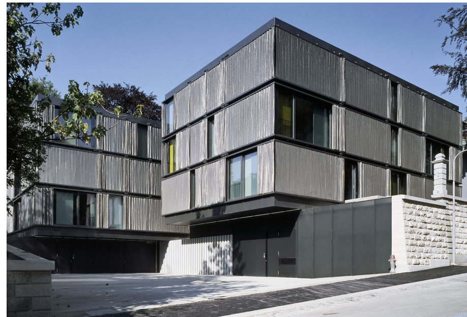
Hohenbühlstrasse Zürich AGPS Architekten, Zürich