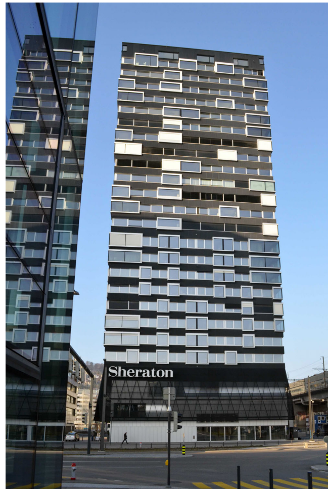
Hard Turm Park Hochhaus Zürich GGA Architekten, Zürich Entwicklung/Realisierung Halter AG