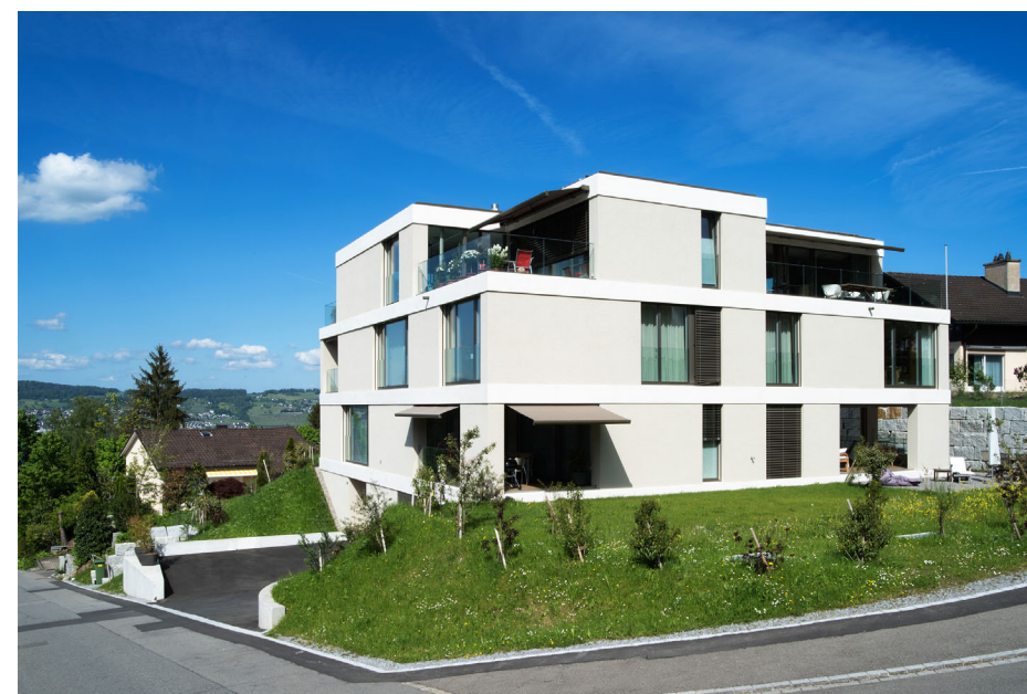
Wohnüberbauung Karl Stamm-Weg, Wädenswil Dachtler Partner Architekten, Zürich Entwicklung/Realisierung Halter AG