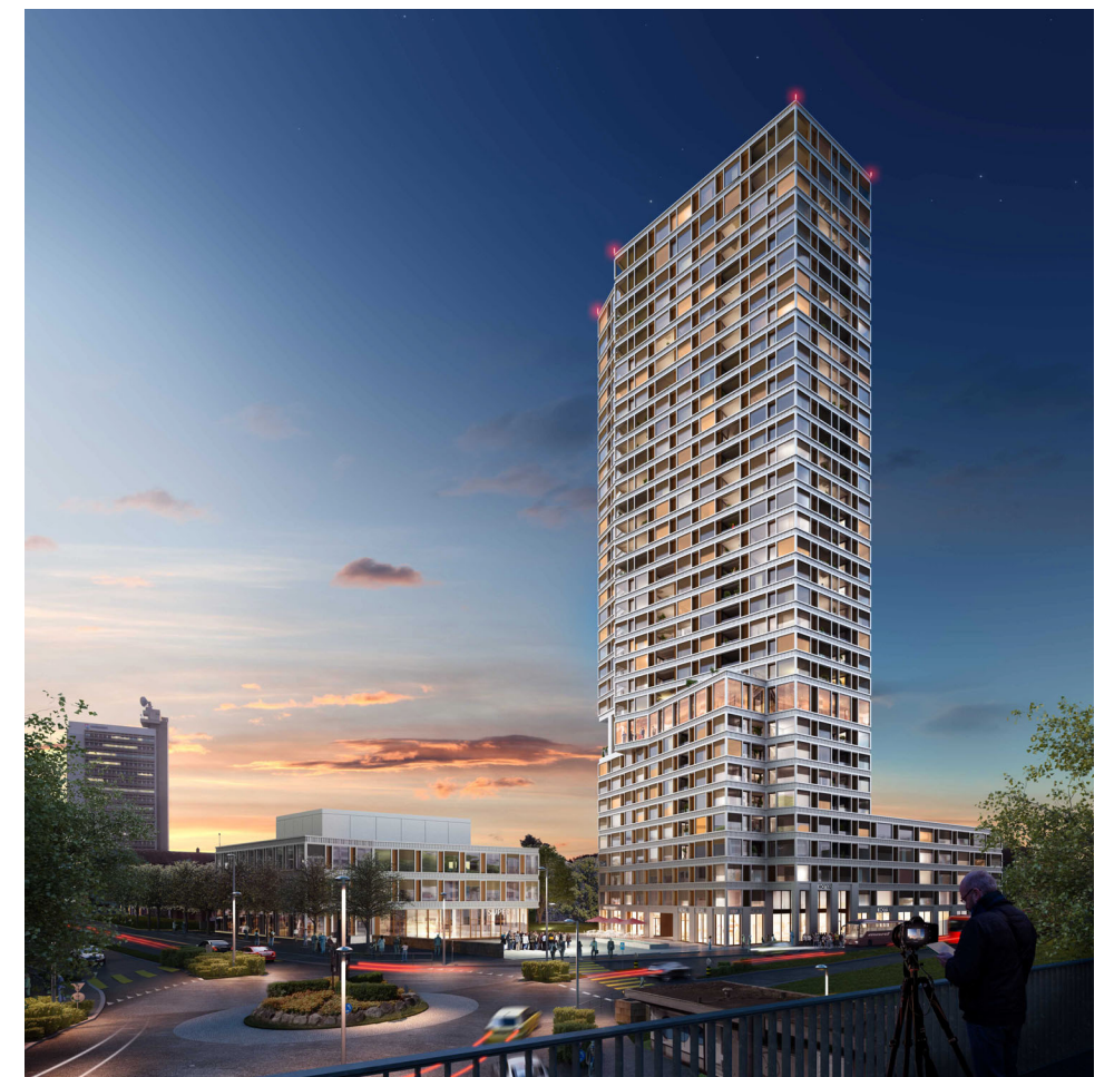
Zentrum Bären, Ostermundigen (Visualisierung) Burkard Meyer Architekten BSA Entwicklung/Realisierung Halter AG (in Ausführung)